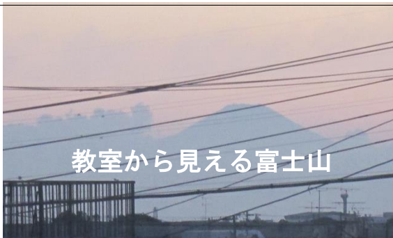
教室から見える富士山